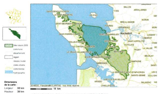
MARAI DE BROUAGE (et marais nord d'Oléron)

IDENTIFICATION ► Appellation : MARAIS DE BROUAGE (et marais nord d'Oléron) ► Statut : Site ou proposition de Site d'Importance Communautaire (SIC/pSIC) ► Code : FR5400431